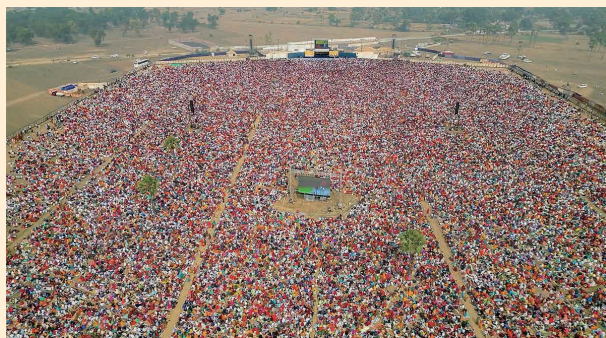
2023年11月、母国インドの講演会に375,603人が参加、ギネス世界記録を樹立した。

2015年秋、初の著書『Pot with the Hole 穴のあいた桶』(日本語版・文屋)を出版。同書は、世界的ベストセラーになった英語版『PEACE IS POSSIBLE』(ペンギンランダムハウスUK)をはじめ、フランス語、ドイツ語、ポルトガル語、スペイン語、ヒンディー語など、22の言語で翻訳出版されている。最新刊は全米ベストセラーの『Hear Yourself』(Harper One)。絵本は『あなたのあいたおけ』『なりたいなあ』(いずれも文屋)がある。